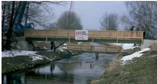
Brücke Mindelheim. Bridge Mindelheim.