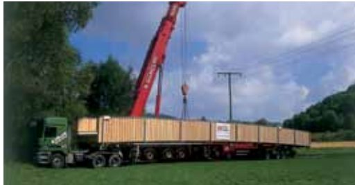
Brücke Schwäbisch Hall. Bridge Schwäbisch Hall.