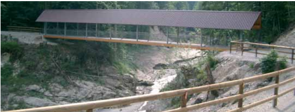
Brücke über die Walchen, am Sylvensteinsee. Bridge over the Walchen, at Sylvensteinsee.