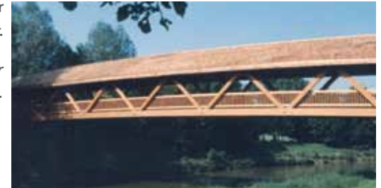
Brücke über die Murr. Bridge over the Murr.