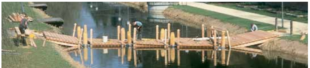
Schwimm-Brücke Neu-Ulm, Glacis Bridge Floß.