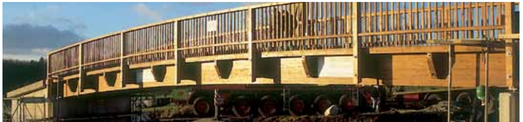
Brücke Oggenhausen. Bridge Oggenhausen.