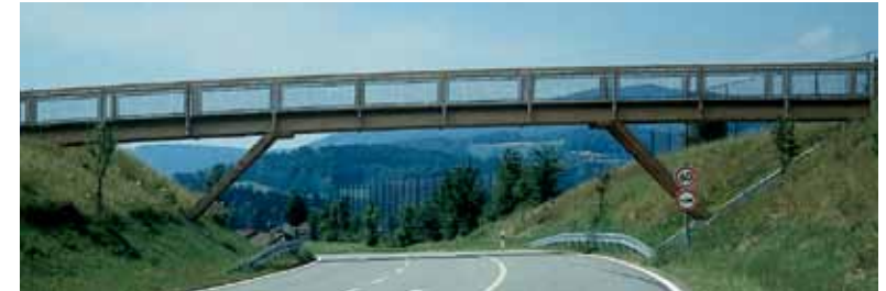
Brücke Lallig. Bridge Lallig.