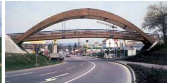
Brücke Backnang. Bridge Backnang.