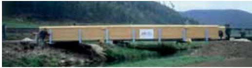
Brücke Schelklingen. Bridge Schelklingen.