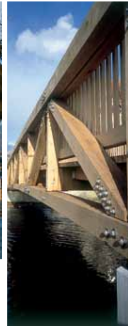
Brücke Sontheim / Brenz Bridge Sontheim / Brenz