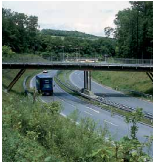
4-Feld-Brücke über die B293, bei Weil im Dorf, Nutzlast 30 Tonnen. 4-Field-Bridge over the B293, near Weil im Dorf, pay load 30 tons.