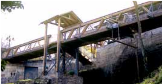
Brücke Biesigheim. Bridge Biesigheim.