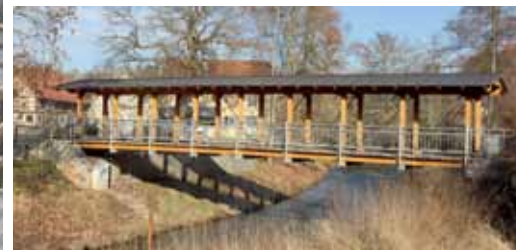
Brücke Ebhausen. Bridge Ebhausen.