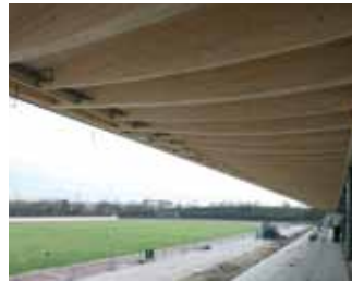
Tribune stadium, Karlsruhe. Archis Architekten