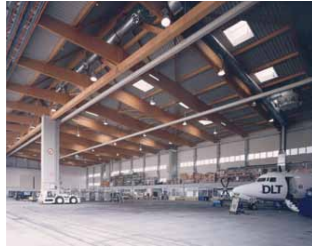
Flugzeughangar, Köln-Bonn. Architekten Baugruppe Köln