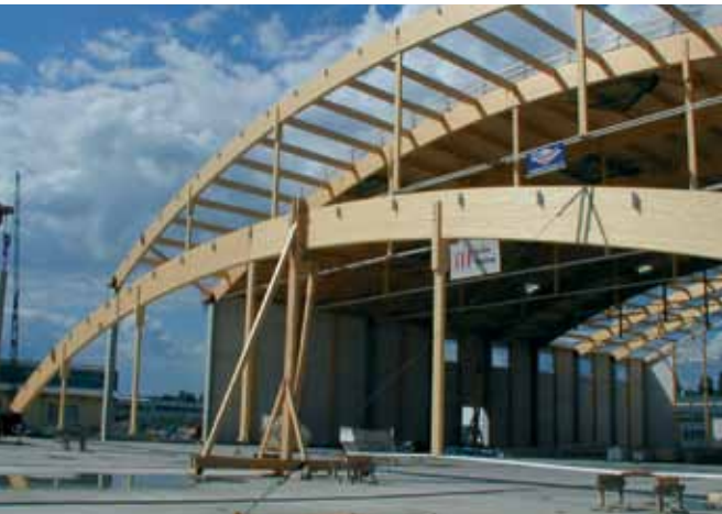
Exhibition hall Sinsheim. architect Luise Layer