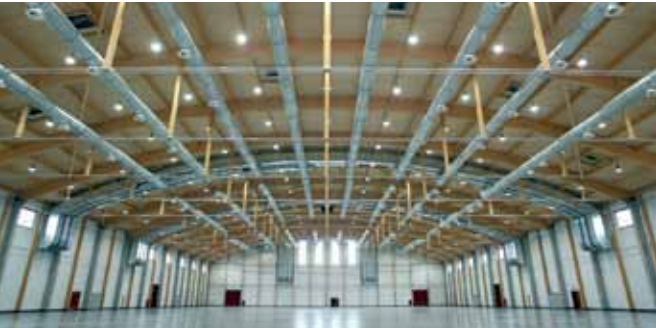
Messehalle Sinsheim. Architekt Luise Layer

Opening up horizons, transcending dimensions, and doing so with seemingly no effort. Building landscapes. Making emotions and thoughts perceptible. Meeting needs that go well beyond the norm. That conceals the desire to resolve special tasks and the joy of helping complex issues to be realised.